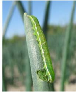
図3 ねぎの葉を加害する シロイチモジヨトウ幼虫