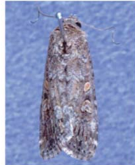
図4 シロイチモジヨトウ成虫