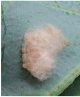
図2 シロイチモジヨトウ卵塊