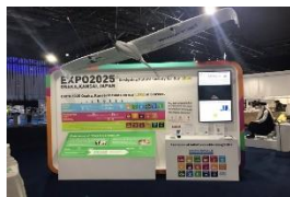
G20大阪サミット（大阪万博ブース）