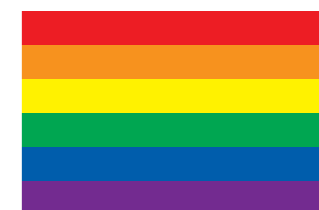
【レインボーフラッグ】

性的マイノリティの尊厳と社会運動を象徴。上から赤・橙・黄・緑・藍・紫の6色で、性の多様性を表しています。