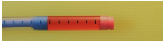
②水を入れたようす