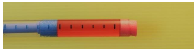
②水を入れたようす