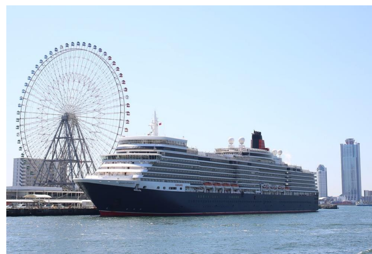
【ヒトの交流、クルーズ客船】