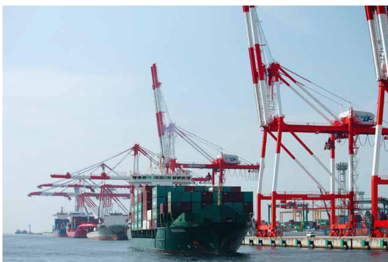
【モノの交流、コンテナターミナル】

※RORO船・・・Roll On Roll Off Ship(ロールオンロールオフ船)の略で、船の中にトレーラーが自走して乗り込むことが可能な構造となっており、クレーンを使わずに直接貨物の積み降ろしができる。