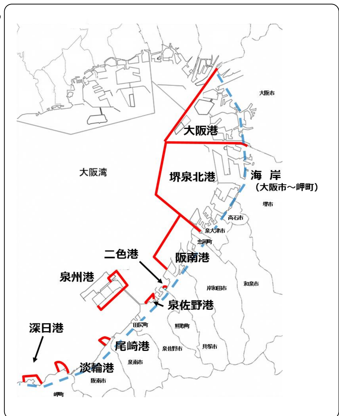
【大阪港湾局 所管区域】

令和の時代を担う利用者へに選択される港として、府市が一体となった相乗効果を発揮することで、これからも大阪・関西経済の一翼を担う港として、大阪“みなと”を発展させていきます。