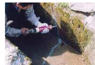
水路のひび割れ補修