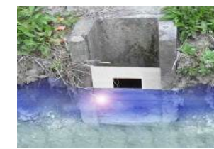
田んぼダムの実施