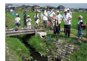
生物調査による啓発