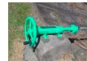
ゲート・バルブの更新