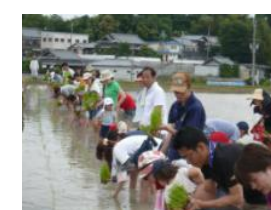
地域住民との交流活動