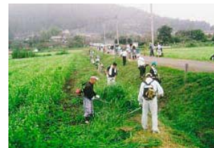
農地のり面の草刈