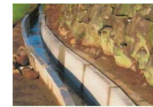
素掘り水路から更新