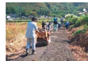
未舗装農道の舗装