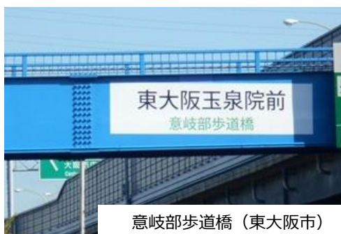
意岐部歩道橋（東大阪市）