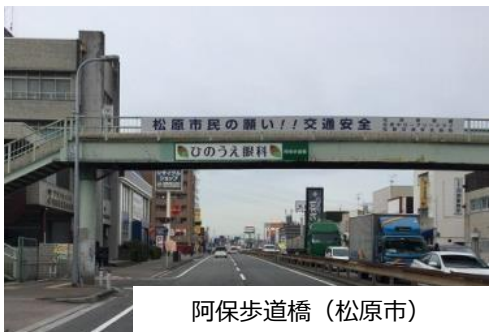
阿保歩道橋（松原市）