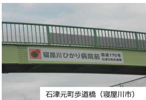
石津元町歩道橋（寝屋川市）