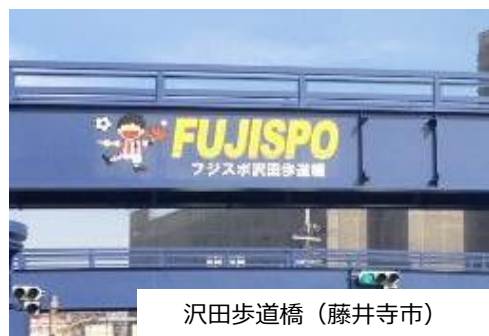
沢田歩道橋（藤井寺市）