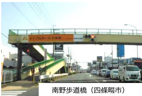
南野歩道橋（四條畷市）