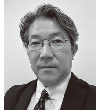
大阪大学大学院医学系研究科・医学部付属病院 産学連携・クロスイノベーションイニシアティブ 特任准教授

佐賀医科大学医学部卒。2010年大阪大学大学院医学系研究科博士課程修了。11年同大学大学院医学系研究科助教、12年厚生労働省医政局研究開発振興課課長補佐(高度医療専門官併任)、19年同大学医学部付属病院未来医療開発部再生医療等支援室副室長などを務め、23年同大学大学院医学系研究科産学連携・クロスイノベーションイニシアティブ特任教授に着任。現在に至る。