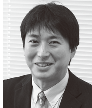
大阪大学医学系研究科特任教授、 日本再生医療学会 常務理事

京都大学医学部卒。同大学大学院医学研究科博士課程修了。医学博士。米国ソーク研究所博士研究員、京都大学医学研究科脳神経外科講師、同大学再生医科学研究所(現医生物学研究所)生体修復応用分野准教授などを経て、2022年より現職。神経難病に対するIPS細胞を用いた細胞移植治療の開発に力を注いでおり、パーキンソン病に対する医師主導治験を行っている。