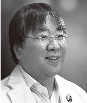
一般財団法人 未来医療推進機構 理事長 大阪警察病院 理事長・病院長、 大阪大学大学院特任教授