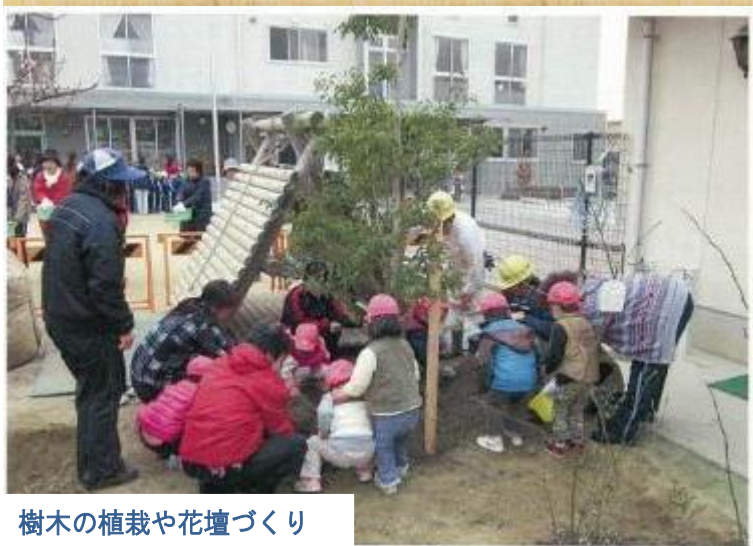
樹木の植栽や花壇づくり