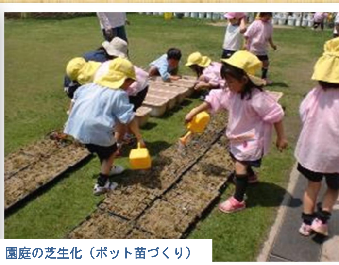
園庭の芝生化（ポット苗づくり）