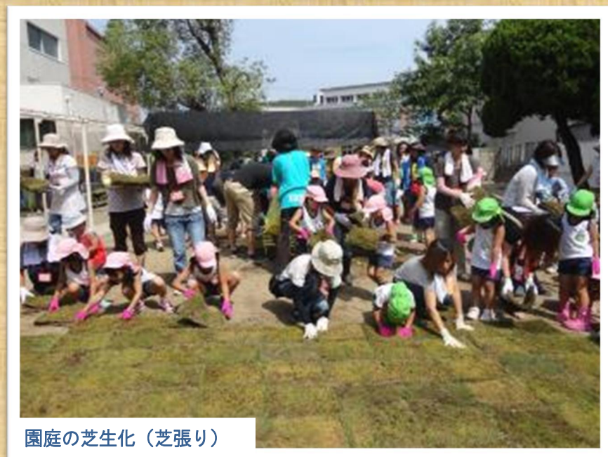
園庭の芝生化（芝張り）