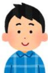
高校生年齢の支援者より

子どもの貧困というと、小中学生にスポットがあたりますが、高校生も深刻な状況です。家族旅行に行ったことがない、誕生日プレゼントをもらったことがない、お金のかかるクラブ活動ができない、そういう子どもたちがいます。