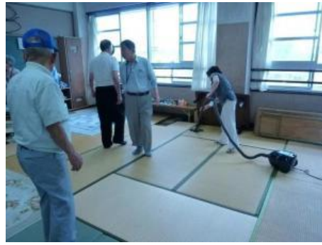
活動の後はすぐに掃