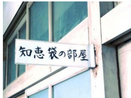
室名札や入口横の窓にも「知恵袋の部屋」の掲示