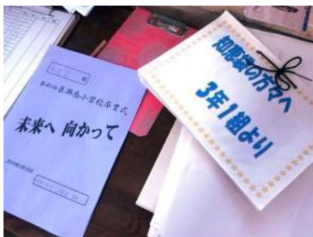
児童からのお礼の手紙や卒業式の招待状