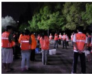
中学校の玄関前に集合する ITS咲かせ隊のみなさん