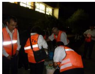
拾ったゴミを分別