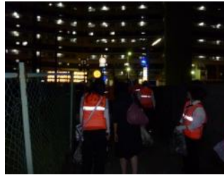
声掛けとゴミ拾い活動へ出発