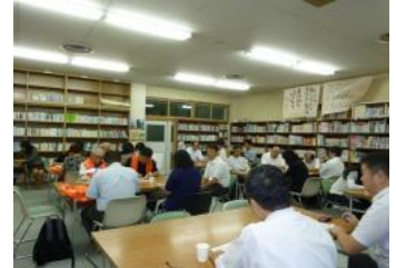
懇話会に参加するITS咲かせ隊 のみなさん