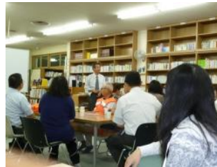
活動終了後、図書館での懇話会