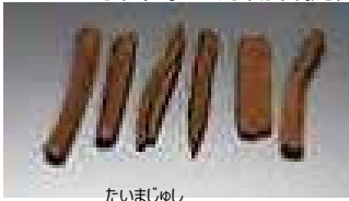
たいまじゆし 大麻樹脂