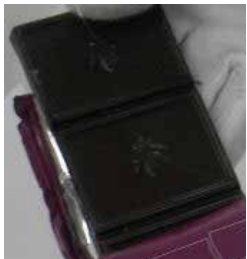
がた チョコレート型