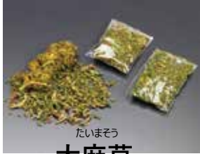
たいまそう 大麻草