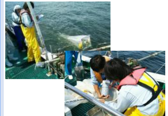
大阪湾のマイクロプラスチック調査の様子