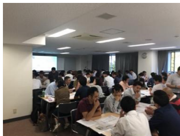
令和元年度養成研修の様子