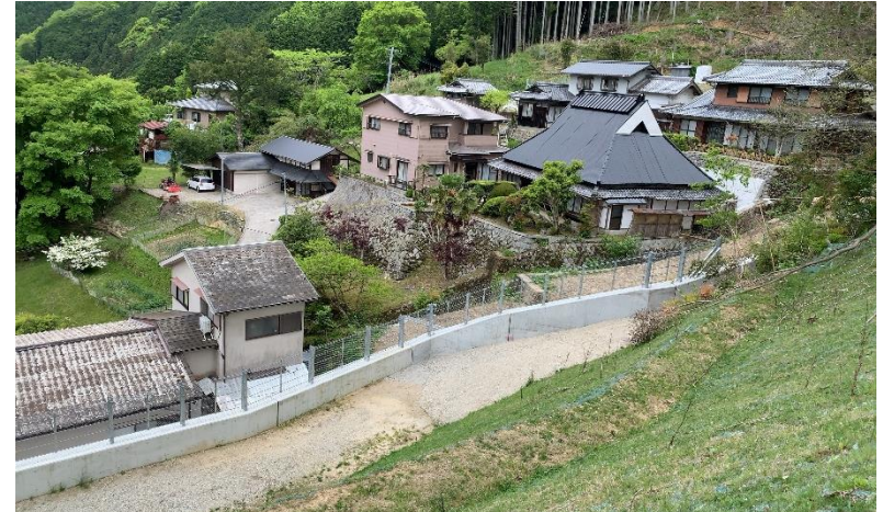
殿方地区急傾斜地 （豊能町域）