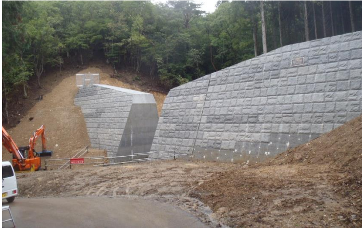
北川2号砂防堰堤 （能勢町域）