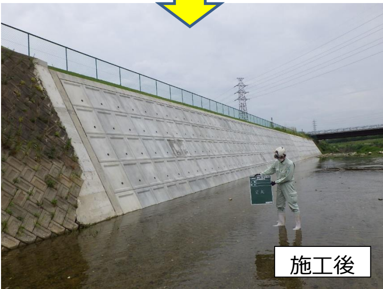
勝尾寺川河道掘削 （箕面市域）