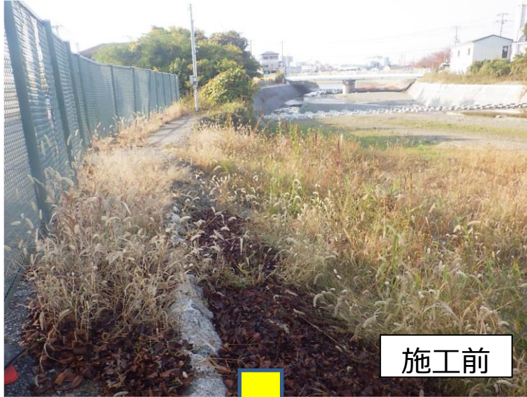
余野川改修 (池田市域)