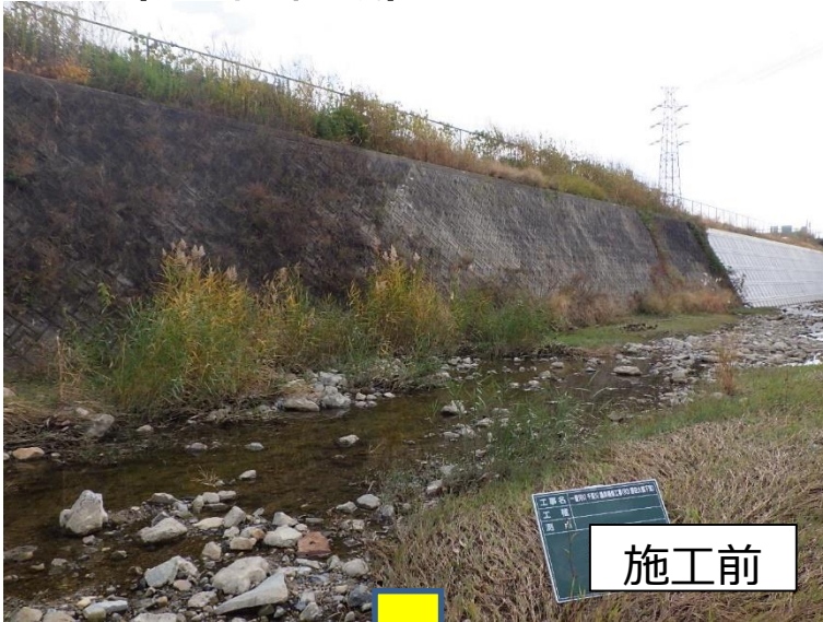
千里川護岸補修 （豊中市域）