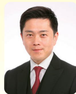
大阪府知事 吉村 洋文

さらに、今般の能登半島地震を踏まえた災害対応力の強化や、府民のいのち・健康・くらしを守る取り組みを充実させ、誰もが安全・安心で豊かに暮らせる社会の実現をめざします。