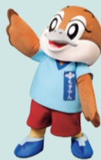
大阪府広報担当副知事 もずやん