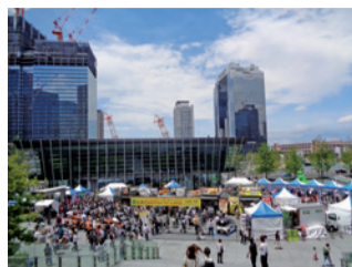
大阪産(もん)マルシェ 2023の様子

新鮮で環境にもやさしい大阪産(もん)やこだわりの大阪産(もん)名品を「食べる」「買う」「体験する」企画をお届けする2日間。物販・キッチンカーブースの他に、ステージイベントなど楽しいコンテンツが盛りだくさんです。