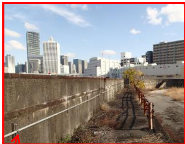
防潮堤の陸側に添架されています