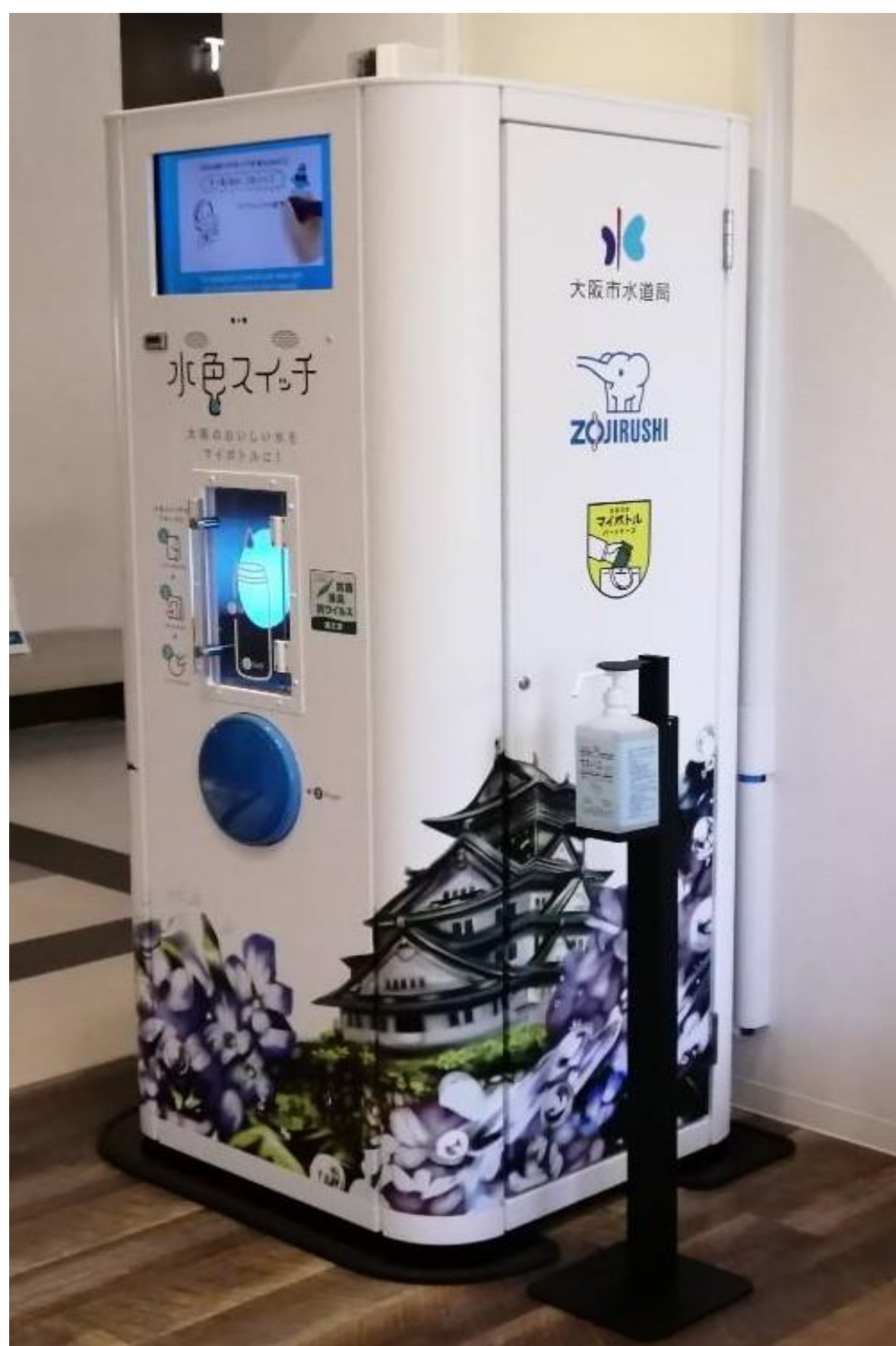
観光施設・商業施設へのマイボトルスポットの設置

府内の公共施設、多くの人を利用する観光・集客施設におけるマイボトルスポットの設置を促進します。