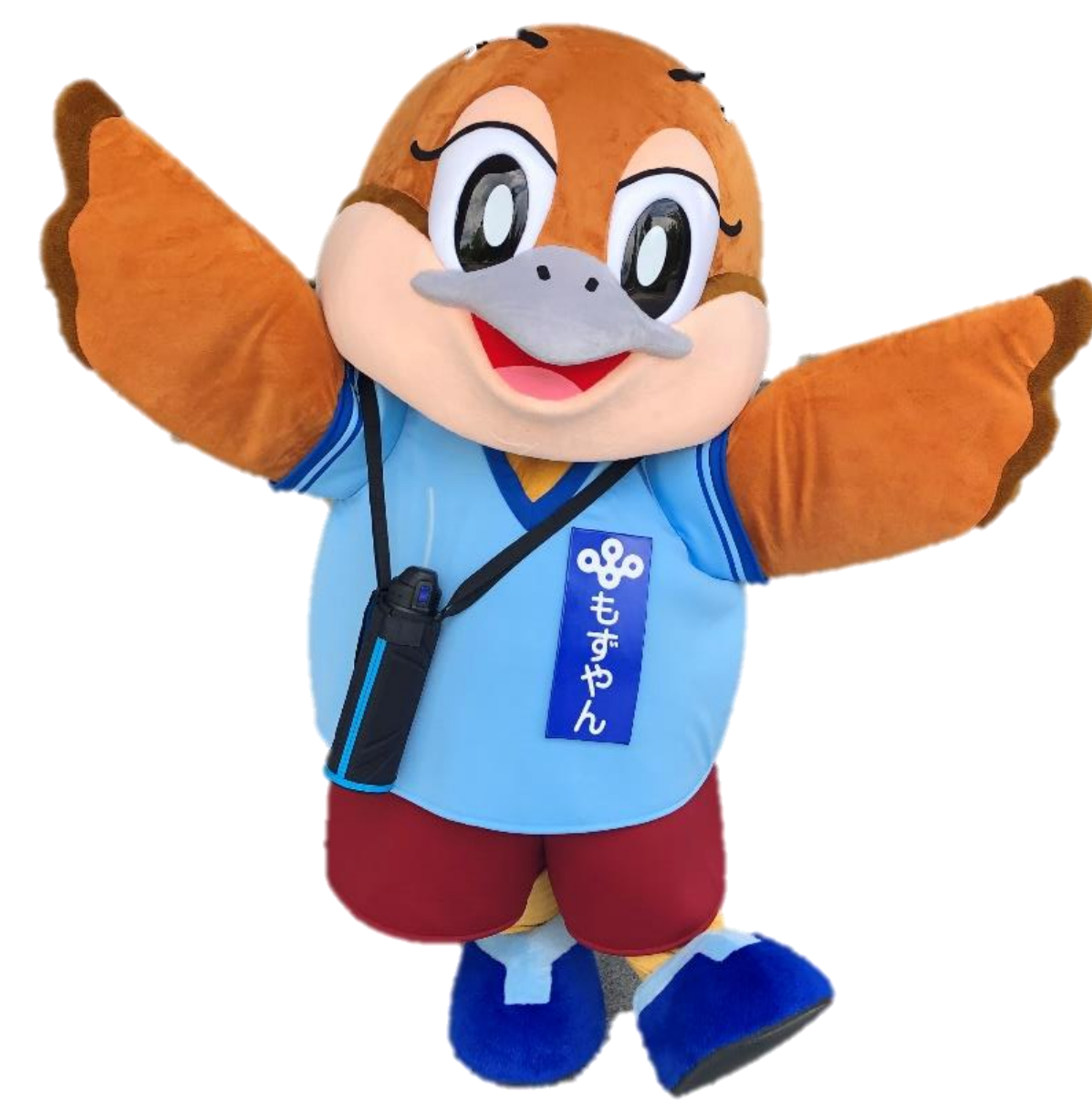
大阪府広報担当副知事もすやん

おおさかマイボトルパートナーズでは、「マイボトルユーザーにやさしい街おおさか」の実現を目指して、さまざまな事業者、NPO、行政等が連携して、マイボトルを持ち歩くエコなライフスタイルの推進やマイボトルスポットの設置・普及に取り組んでいます。