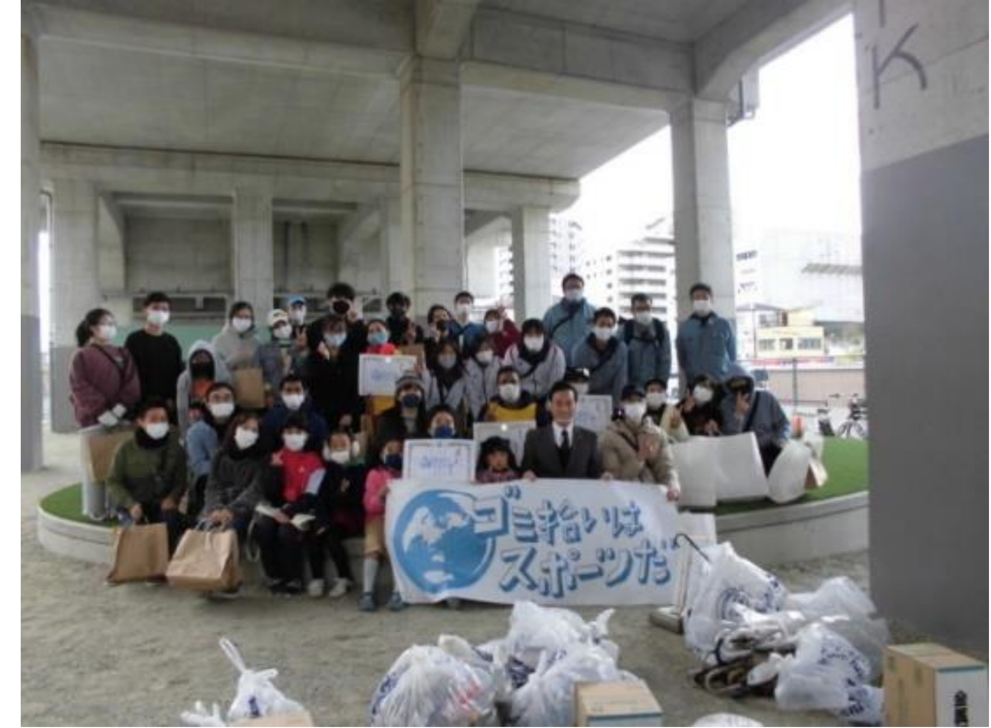
スポGOMI大会inいずみおおつ