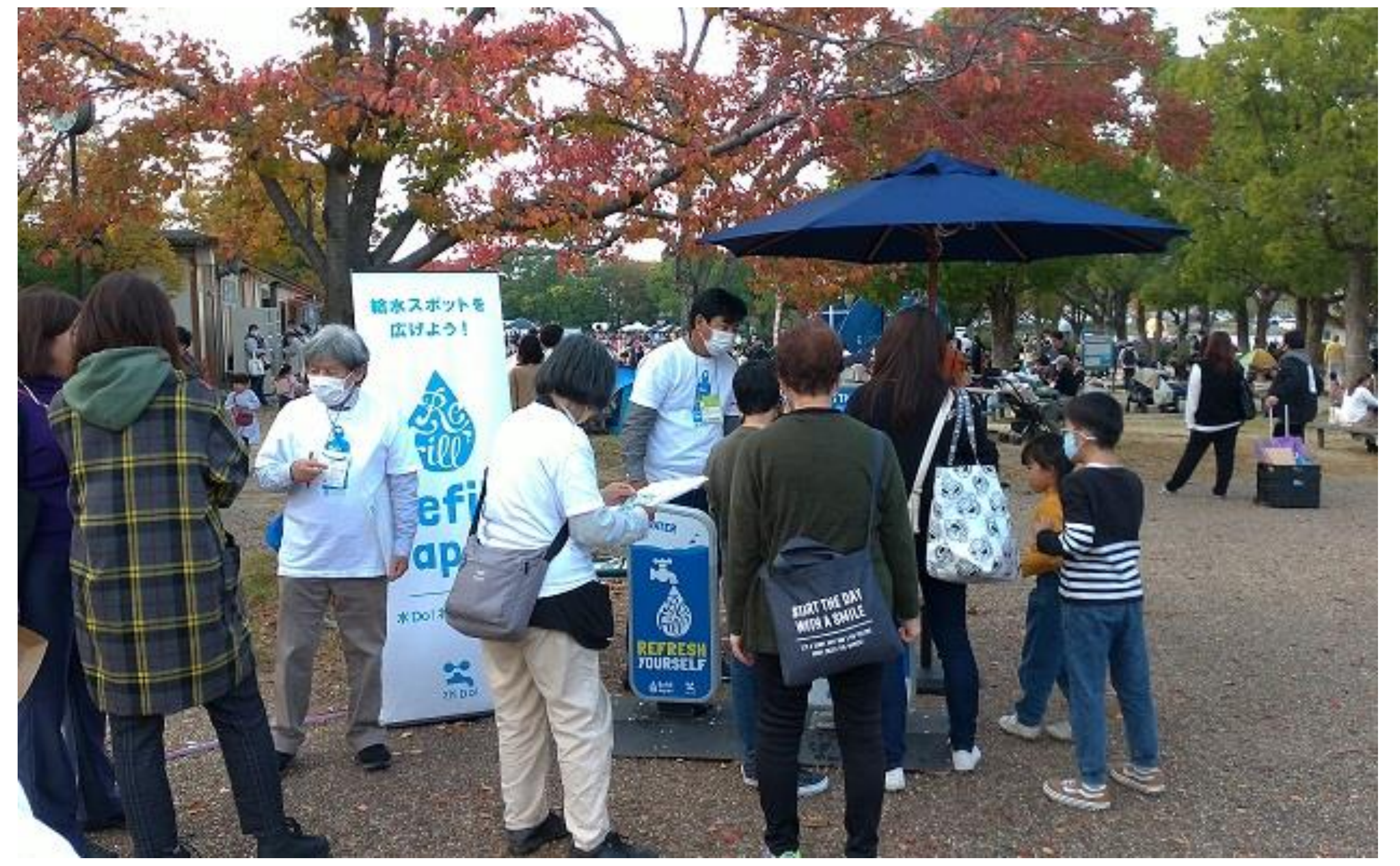
イベントにおけるマイボトルスポットの設置