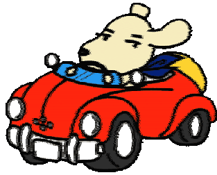
【軽自動車税税額表】