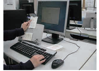
▲事務補助作業(データ入力)