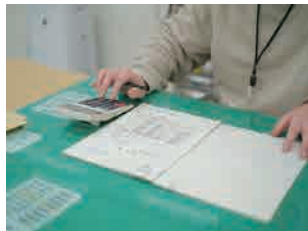
▲事務補助作業(請求書の作成)